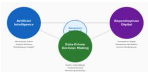
Gambar 1. Model Konseptual Manajemen Pendidikan Digital

Berdasarkan hasil sintesis literatur, transformasi manajemen pendidikan digital dipengaruhi oleh tiga komponen utama, yaitu Artificial Intelligence, Data-Driven Decision Making, dan kepemimpinan digital. Artificial Intelligence berperan sebagai teknologi pendukung dalam pengelolaan administrasi akademik, analisis performa peserta didik, serta pengembangan sistem pembelajaran adaptif. Pendekatan Data-Driven Decision Making berfungsi sebagai strategi manajerial dalam perencanaan kebijakan pendidikan, evaluasi pembelajaran, serta peningkatan mutu pendidikan. Sementara itu, kepemimpinan digital berperan sebagai faktor penggerak transformasi dalam mengelola perubahan organisasi pendidikan dan meningkatkan kesiapan sumber daya manusia.